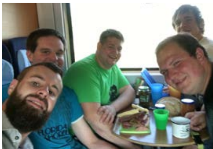
Die Vertreter des Team Agrar auf dem Weg zur Preisverleihung

Schwerpunktmäßig wollen wir über Tierhaltung, Düngung, Pflanzenschutz und Naturschutz sprechen aber vor allem mit Konsumenten über deren Fragen und Wünsche diskutieren. Wir denken, dass wir uns dadurch auch selbst weiterentwickeln können.