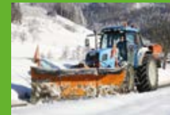
Zuerwerb für Mitglieder